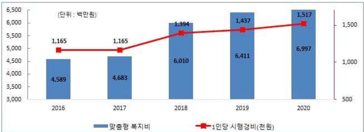
맞춤형복지제도 시행경비 연도별 추이

☞ 맞춤형복지제도 시행경비는 대상인원 150명 증가에 따라 지난해에 비해 586백만원이 증가하였습니다.